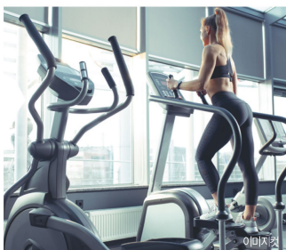
이미지컷 휘트니스 센터 입주민의 건강을 위한 공간