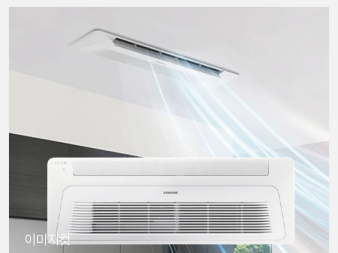
이미지컷 빌트인 에어컨(각방/거실)