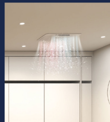
| 주방 공기청정 시스템