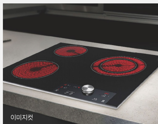
이미지컷 빌트인 인덕션