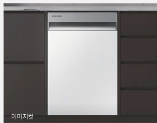
이미지컷 빌트인 식기세척기