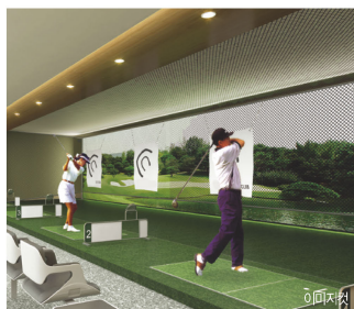
이미지컷 실내 골프연습장, 퍼팅존 입주민의 레저를 위한 프리미엄 시설!