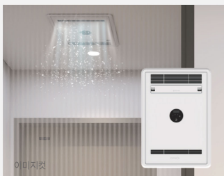
이미지컷 현관 공기청정 시스템