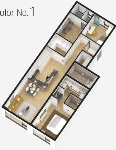
Color No. 1

입주인이 직접 선택하는 인테리어 컬러 설계 - 다양함이 가득한 특별한 공간이 펼쳐집니다!