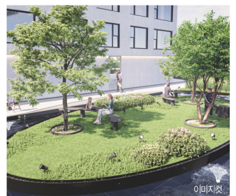
이미지컷 중정, 중앙분수 단지 내 휴식공간 및 분수 설치로 힐링!