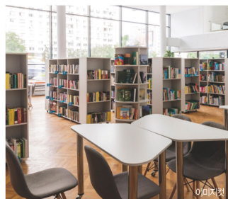
이미지컷 회의실 및 독서실 우리아이와 입주민을 의사소통 공간!